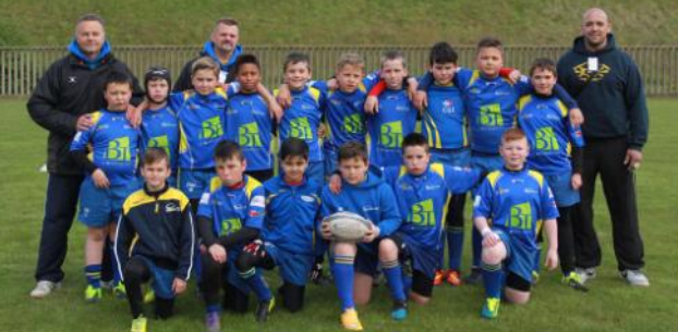
Marcq en Baroeul